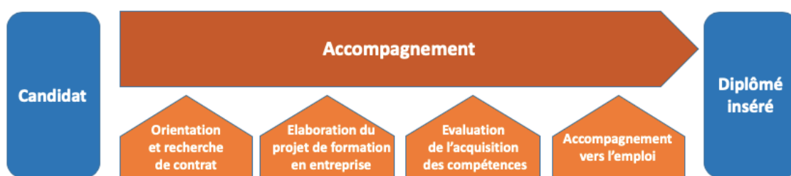
Fig. 1 – Processus de la candidature à l'insertion de l'apprenti

La charte embrasse toutes les étapes du processus, de la définition du projet d'orientation à l'accès à l'emploi. Elle propose également un outil permettant aux parties prenantes d'identifier les jalons d'une auto-évaluation visant l'excellence de l'apprentissage dans l'enseignement supérieur.