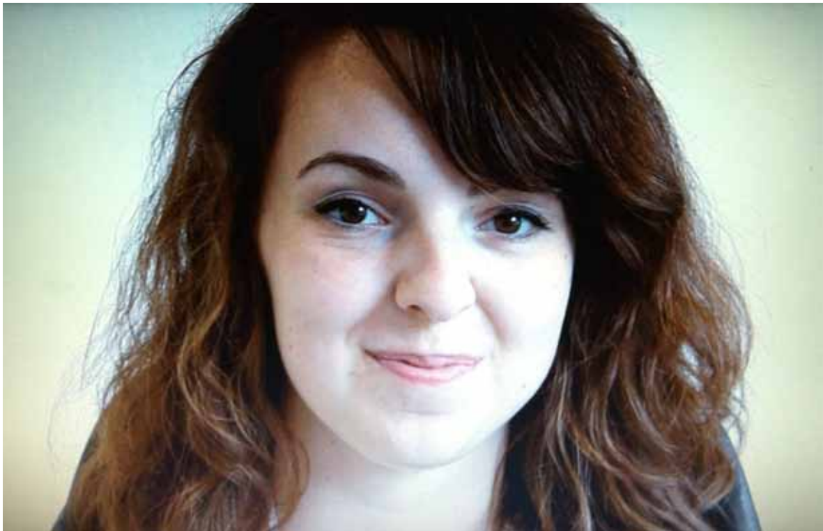
envisage moi