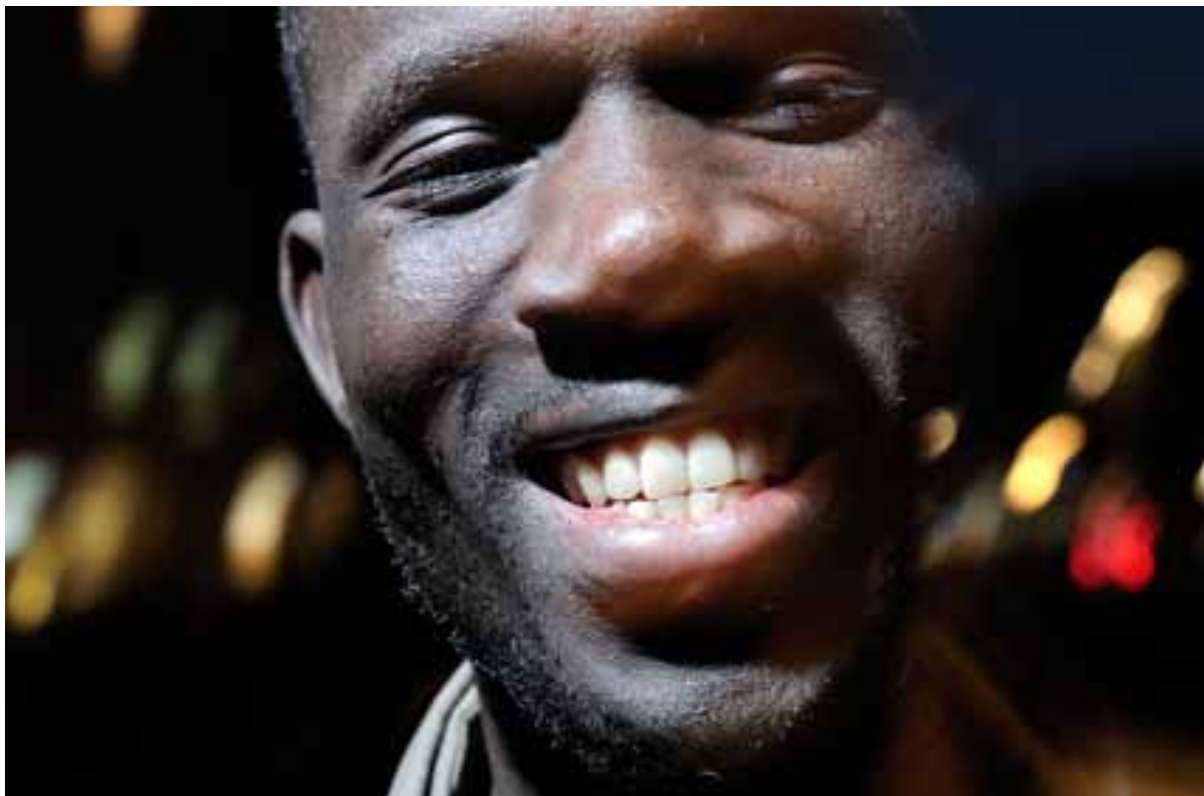
envisage moi