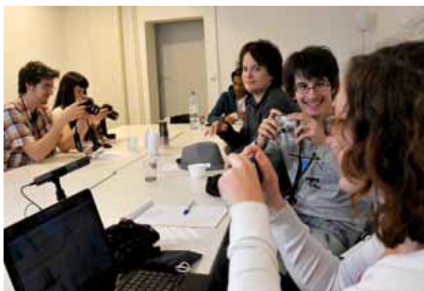
Journée d'atelier à La Chambre