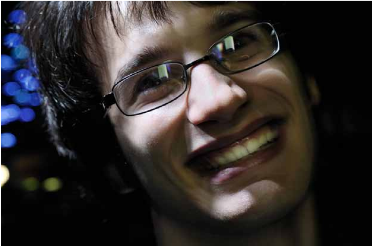
envisage moi