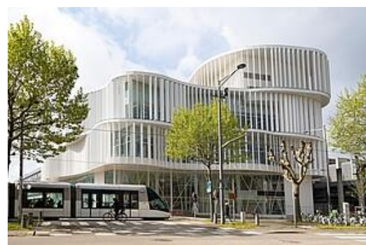
vidéo de présentation de l'Université de Strasbourg